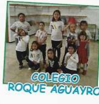
COLEGIO ROQUE AGUAYRO