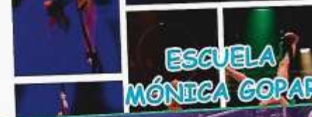
ESCUELA MÓNICA GOPAR