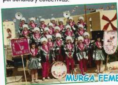
MURGA FEMENINA LAS-DECIDIDAS

Otro reconocimiento importante, en la presente edición, es para la Murga femenina LAS DECIDIDAS de Carrizal, que tuvieron presencia en el Carnaval al final de la década de los años 80. Mujeres decididas, que se atrevieron a desafiar a los tiempos e incorporar su talento más allá de la cocina y labores domesticas.. Para ellas y con el paso de los años, rememoran los recuerdos de aquella etapa como una grata experiencia llena de anécdotas personales y colectivas.