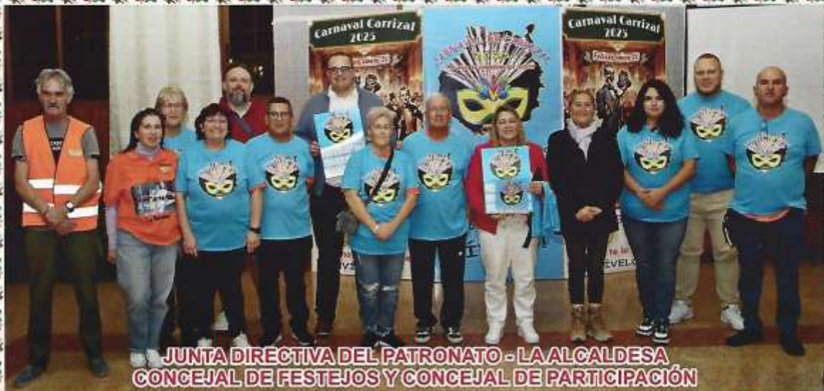
JUNTA DIRECTIVA DEL PATRONATO - LA ALCALDESA CONCEJAL DE FESTEJOS Y CONCEJAL DE PARTICIPACIÓN