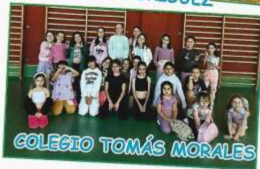
COLEGIO TOMÁS MORALES