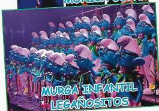
MURGA INFANTIL LEGAÑOSITOS